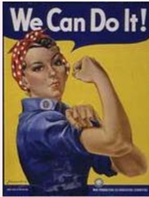
Cartel diseñado por J. Howard Miller.

71% de los directores y gerentes y ellas el 63% de la fuerza laboral en ocupaciones elementales (EPA, INE).